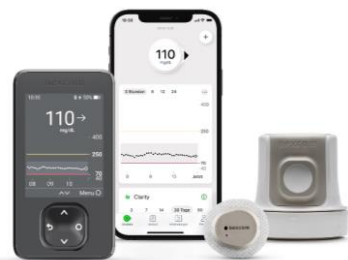
Abbildung: Empfänger optional. Smartphone ® nicht im Lieferumfang enthalten.

Das Dexcom G7 ist in den Einheiten mg/dL oder mmol/L verfügbar.